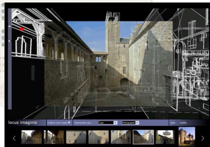
Culot galerie sud du cloître du couvent - quatrième culot est, cote bati [ culot_d1 ]